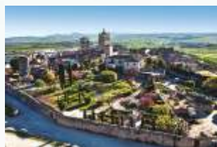
Vistas de la villa desde el castillo

Nuestra ruta comienza en la plaza Mayor , lugar elegido por la nobleza trujillana en los siglos XV y XVI para levantar sus grandes palacios, como el de Carvajal-Vargas, el del marqués de la Conquista o el de Orellana-Toledo. Empezaremos por la oficina de turismo, donde ofrecen información amplia y precisa de todo lo que podremos ver; la estatua ecuestre de Francisco Pizarro y la iglesia de San Martín , ambas en la misma plaza, serán nuestros primeros destinos.