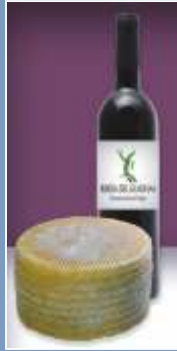
Queso de oveja y Ribera del Guadiana

La cocina trujillana hunde sus raíces en la tradición secular y conventual: jamones y embutidos del cerdo ibérico; el vino, integrado en la D.O.P. Ribera del Guadiana, o los quesos de oveja y cabra son algunos de sus mejores viandas. Precisamente destaca por su repercusión la Feria Nacional del Queso de Trujillo, escaparate de los mejores quesos que se realizan en Extremadura y la península.