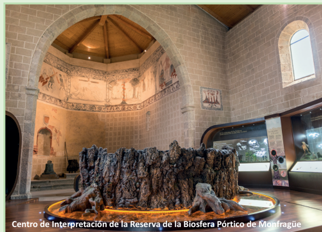
Centro de Interpretación de la Reserva de la Biosfera Pórtico de Monfragüe