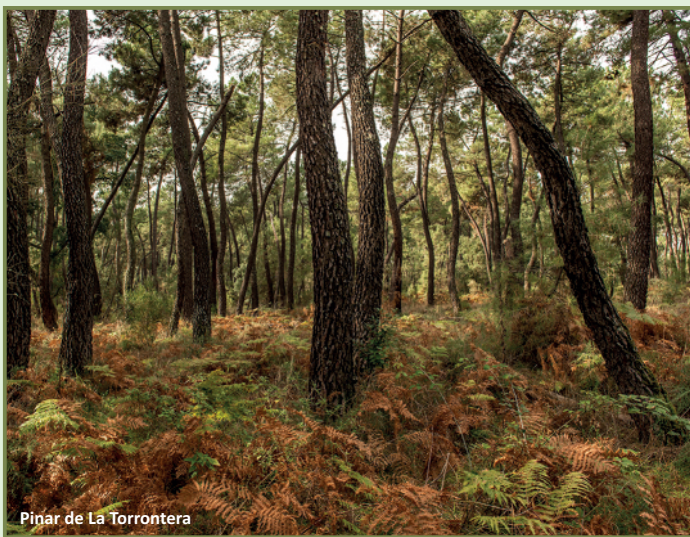
Pinar de La Torrontera

La ruta discurre por impresionantes dehesas de encinas ( Quercus ilex subsp. ballota ) y alcornoques ( Quercus suber ) que forman parte de una de las masas boscosas de este tipo más relevantes a nivel mundial: las dehesas de la reserva de la biosfera de Monfragüe. En el sector de las dehesas de Mirabel, ya en las vegas del Tiétar, la vegetación cambia a cultivos de regadío, especialmente tabaco y pimiento para la fabricación del conocido pimentón de La Vera, cruzando también el pinar de la Torrontera, un bosque de pino resinero ( Pinus pinaster ) reducto de los grandes pinares autóctonos que esta especie mantuvo a orillas del río Tiétar. La curiosa forma retorcida de la mayoría de sus fustes se debe a la extracción sistemática de los más derechos para construcción de edificios como la catedral de Plasencia. Estas dehesas y regadíos son el hábitat que miles de grullas ( Grus grus ) procedentes del centro y norte de Europa eligen para pasar el invierno, y de numerosas aves forestales.