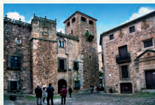
Golfinos de Abajo

Subiremos ahora la empinada Cuesta de la Compañía, donde nos detendremos en el Centro de la Divulgación de la Semana Santa, antes de continuar y girar a la izquierda por el estrecho callejón de D. Álvaro. Desembocaremos entre casas encaladas en el barrio de San Antonio , la judería Vieja, para continuar después hacia la plaza de las Veletas , que toma el nombre del palacio que alberga el actual Museo Provincial de Cáceres.