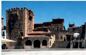
Torre de Bujaco (plaza Mayor)