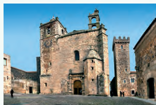
San Mateo y torre de las Cigüeñas

Tras una breve visita al interior de la iglesia de San Mateo retomaremos la ruta por la angosta calle de la Monja para detenemos ante la Casa del Sol y la Casa del Águila, un rincón de extraordinaria belleza ante grotescas gárgolas que parecen tocar la cercana y majestuosa torre de Sande. Nos dejaremos llevar por estas calles empedradas y sinuosas para desembocar en la Cuesta de Aldana , que bajaremos entre nobles palacios como el de los Pizarro-Espadero o Casa del Mono.