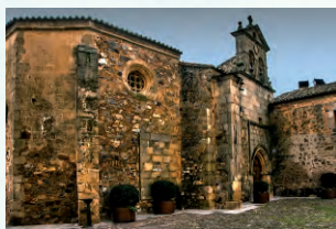
Convento de San Pablo

Sus más de 45 pasos, de los cuales cerca de la mitad son del siglo XVII o anteriores, y el atractivo que aporta a las procesiones el escenario inigualable de la ciudad monumental, contribuyeron a su declaración como Fiesta de Interés Turístico Internacional en 2011. Sin duda uno de sus momentos más emocionantes es la salida el Miércoles Santo de la cofradía del Cristo Negro, constituida en 1490.