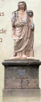
Diosa romana Ceres

Es habitual ver peregrinos en sus inmediaciones, pues está al pie de la Vía de la Plata que lleva a Santiago de Compostela.