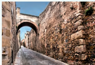
Muralla en la calle Adarve de la Estrella

Seguimos hasta la plaza de Caldereros , donde observaremos la muralla a través de su adarve. Tendremos la opción de pasear sobre la muralla si accedemos al Centro de Interpretación de las Tres Culturas, en la torre de Bujaco; de esta forma unas inmejorables vistas de la ciudad monumental y de la plaza Mayor pondrán fin a nuestro recorrido.