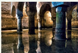
Aljibe de las Veletas