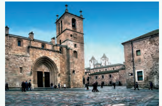
Plaza de Santa María

Comenzaremos en la plaza Mayor , un espacio renovado y auténtico epicentro de la vida social cacereña, donde tras informarnos en la oficina de turismo observaremos parte de la antigua muralla árabe, la torre de los Púlpitos y la de Bujaco , emblema de la villa. Tras pasar bajo el arco de la Estrella giraremos a la izquierda para introducimos en la ciudad antigua descubriendo palacios como el de Toledo Moctezuma, hasta desembocar en la plaza de Sta. María , que alberga la concatedral homónima, el palacio Episcopal, el de Mayoralgo y junto al templo mencionado, el recomendable palacio de Carvajal, sede del Servicio de Turismo de Diputación de Cáceres.