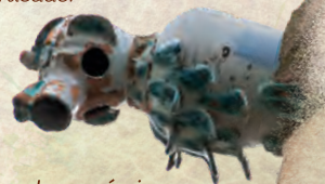
Gárgolas cerámicas en las Veletas

El Museo Provincial de Cáceres merece una visita: contiene fondos que abarcan desde la Prehistoria hasta la etapa contemporánea. Ubicado en los terrenos que ocupara el antiguo alcázar árabe, lo integran dos inmuebles: el palacio de las Veletas, del siglo XV con añadidos posteriores, y la Casa de los Caballos, antigua caballeriza. No debemos perdernos el gran aljibe almohade bajo el patio porticado.