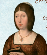
Isabel I de Castilla

La reina Isabel la "Católica" visitó la villa de Cáceres en dos ocasiones: 1477 y 1479, alojándose en el palacio de los Golfines de Abajo. Juró los fueros de la ciudad, junto al arco de la Estrella, y eliminó el carácter militar de los edificios, desmochando la mayoría de sus torres.