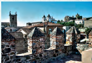
Muralla y torre de la Yerba