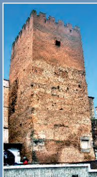
Torre de la Yerba

Uno de los principales legados de la dominación islámica en la ciudad es la muralla almohade, que en el s. XII protegía Cazires del avance cristiano. Los aljibes repartidos por la ciudad, como el del palacio de las Veletas; la torre de Bujaco y de la Yerba (visibles desde la Plaza Mayor), o la casa Mudéjar, son algunos ejemplos de la impronta árabe en Cáceres.